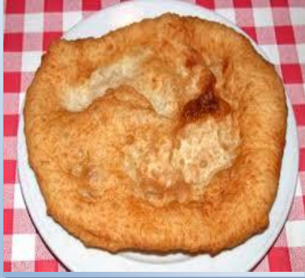
Lángos Langosch Langosh