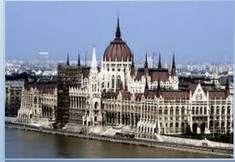
Parlament Budapest Ungarn