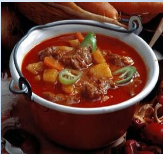
Gulyásleves Gulaschsuppe Gulashsoup