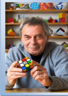
Ernő Rubik 13. 07. 1944- Erfinder Rubik-Würfel