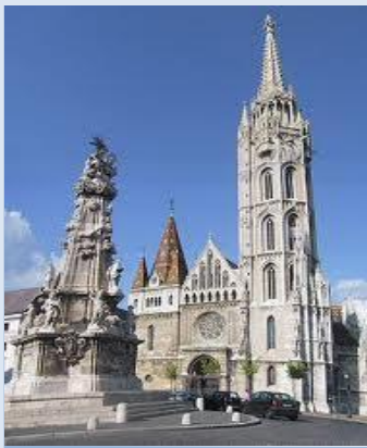
Mathias Kirche Budapest Ungarn