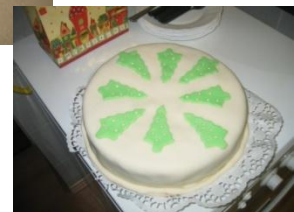
Saját készítésű ágytakaró és torták